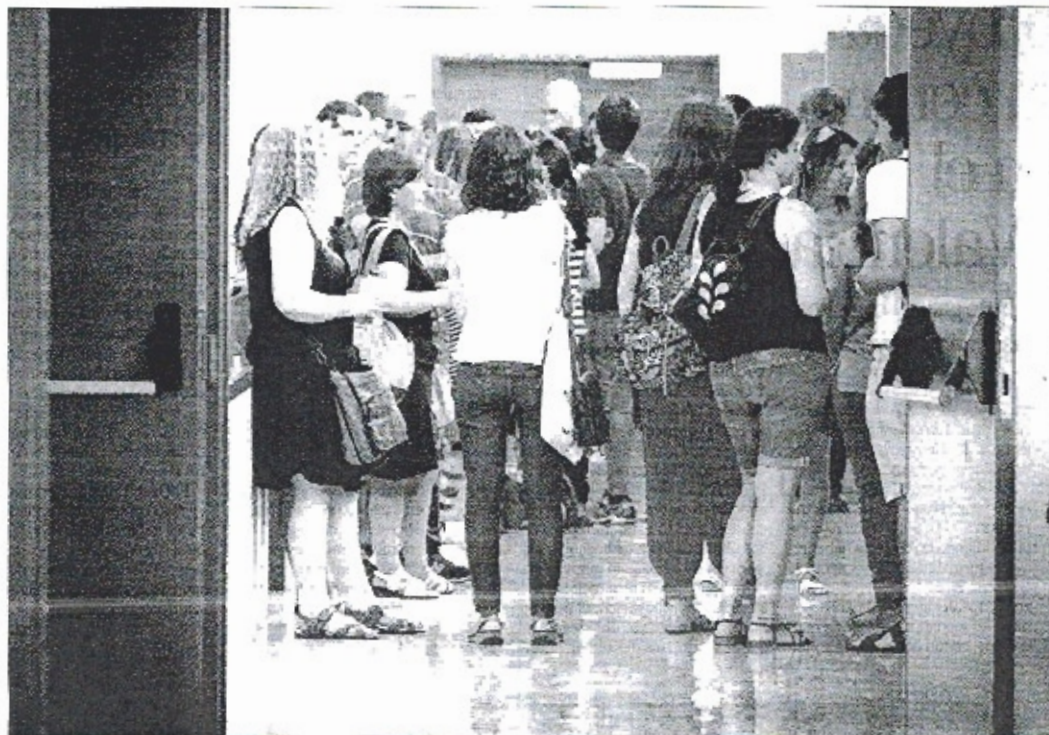
Aspirantes a una de las 1.000 plazas de docente, antes de entrar a la primera prueba selectiva. JOSÉ CILLIÁN